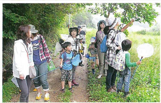
自然回復を試みる会・ビオトープ孟子