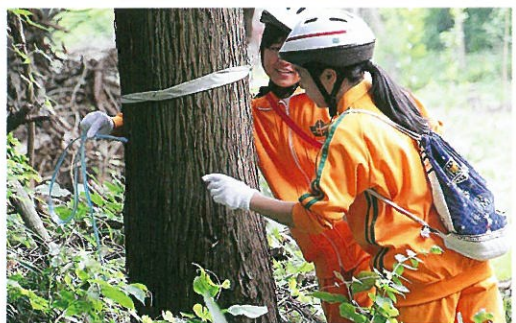
こが里山を守る会